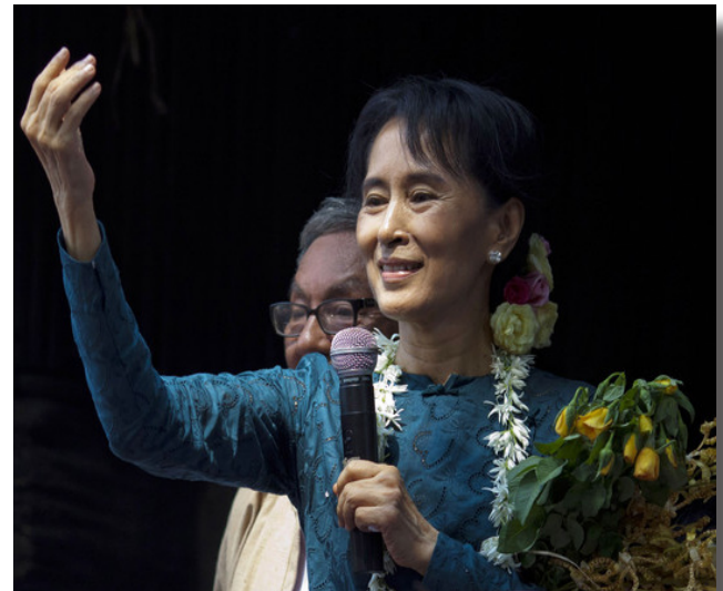
Daw Aung San Suu Kyi, Burma, 1991