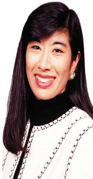
Andrea Jungchief executive of Avon