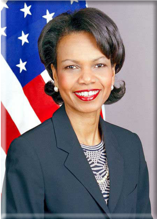
Condoleezza Rice Former U.S. Secretary of State, National Security Advisor under President George W. Bush