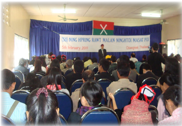
Hpawng Hpaw akyu hpi nga yang