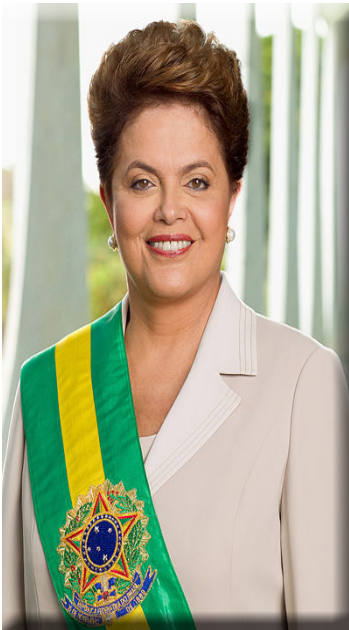
DILMA ROUSSEFF, CURRENT PRESIDENT OF BRAZIL AND WAS THE FIRST WOMAN CHIEF OF STAFF