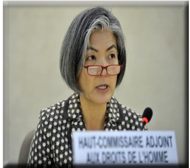
Kyung-Wha Kang Deputy High Commissioner for Human Rights (15 January 2007) The republic of Korea (South)