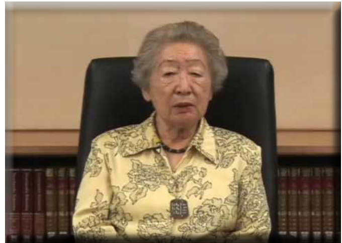
Mrs. Sadako Ogata, Former UNHCR from 1991 until 2001