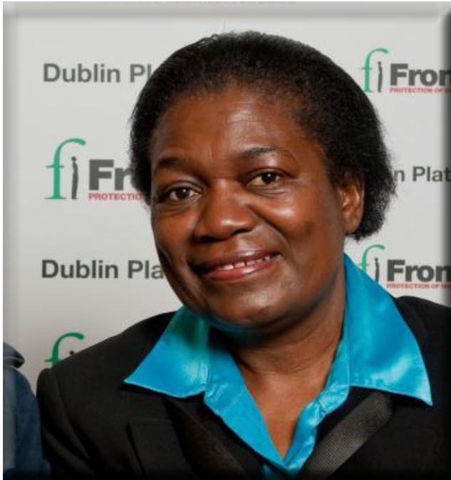
Margaret Sekagya, UN Special Representative on Human Rights Defenders (2008 -current)