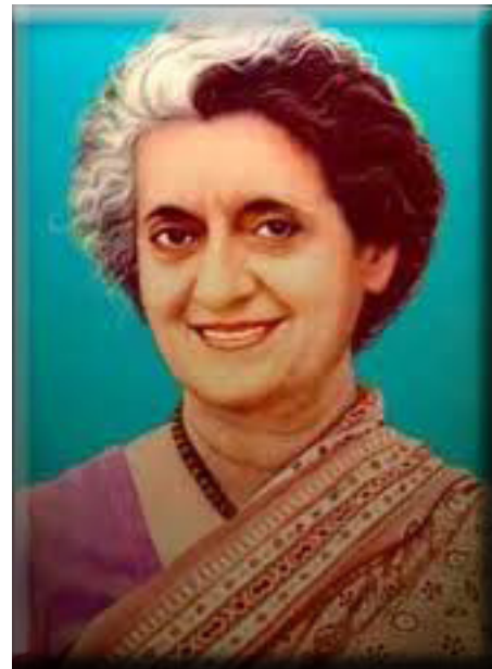
Indira Gandhi India