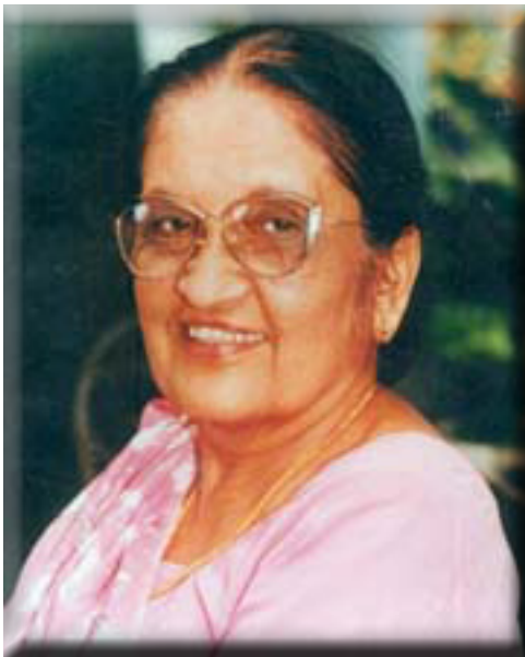
Sirimavo Ratwatte Dias Bandaranaike The world's first female prime minister Sri Lanka