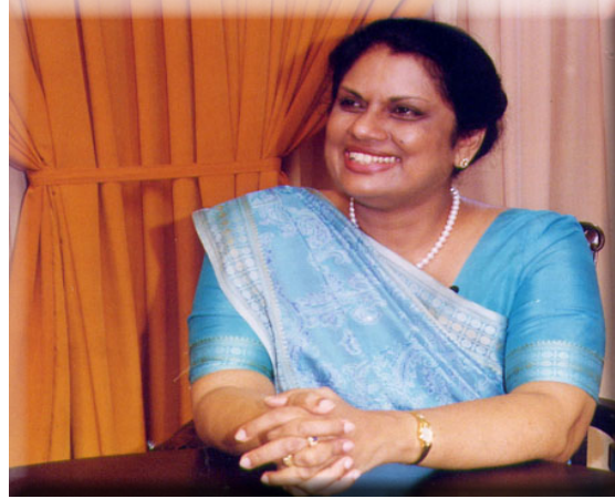
Chandrika Bandaranaike Kumaratunga Sri Lanka, 4th President in 1994 -2005

1911 March shata praw 8 ya hta hpang nna, mungkan myu shayi n-htoi hpe shaning shagu galaw lai wa sai. Dai ning 2011 gaw mungkan myu shayi nhtoi galaw ai 100 ning hpring sai. Mungkan hta mying kaba ai myu shayi ningbaw ningla marai 100 hpe lata ai shaloi myen mung na Daw Aung San Suu Kyi mung lawm nga ai. Dai myu shayi 100 kaw na, marai 10 a sumla hte shanhte hpa baw amu gun lai wa sai / gun taw ai hpe tsun dan mayu ai.