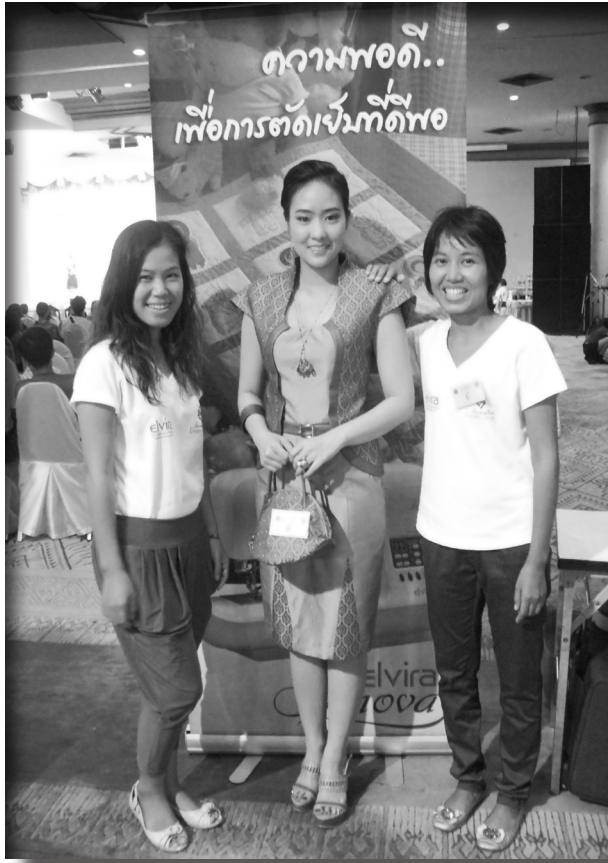
shingjawng poi shanglawm ai manang ni hte rau

Myit ma myit dik ai. Raitim Myen Mung Jinghpaw myu masha langai hku na lu shingjawng na kum hpa lu ai rai yang ndaï hta grau na myit dik na re. Du wa na shaning hta Myen Mungdan jinghpaw masha langai hku na lu shingjawng na re ngu myit mada ai .