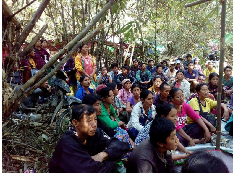
IDPs from Awng Lawt fleeing in the jungle