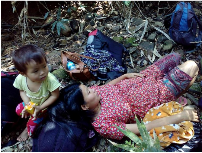
AwngLawt IDPs in the jungle.