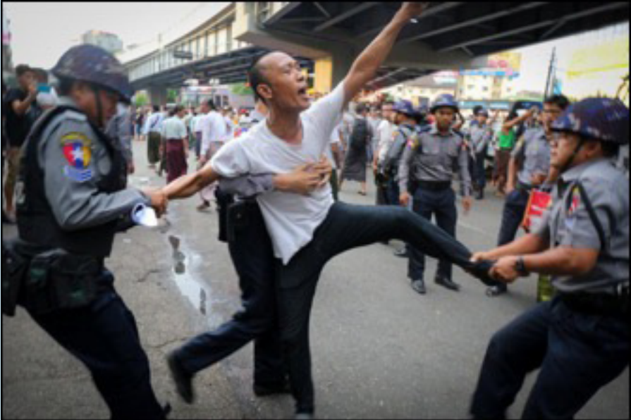
၂၀၁၈ ခုနှစ် မေလ ၁၅ရက်၊ ဆန္ဒပြသူများအား ရဲတပ်ဖွဲ့မှ ဖမ်းဆီးနေစဉ်

ကချင်ပြည်နယ်တွင် စစ်ဆန့်ကျင်ရေးဆန္ဒပြပွဲများ ဧပြီလကုန်မှ မေလအစပိုင်းအထိ ပြုလုပ်ခဲ့ကြသည်။ စစ်တပ်မှ ကချင်အရပ်သားများအပေါ် လူ့အခွင့်အရေးချိုးဖောက်သည်ဟု ဆန္ဒပြပွဲဦးဆောင်သူများက စွပ်စွဲပြောကြားမှုအပေါ် မြောက်ပိုင်းတိုင်း စစ်ဌာနချုပ်မှ ၎င်းတို့အား အသေရေဖျက်မှုဖြင့် တရားစွဲခဲ့သည်။ နောက်ထပ်ဦးဆောင်သူ ၂ ဦးကိုလည်း ငြိမ်းချမ်းစွာစုဝေးခွင့်ပုဒ်မ ၁၉ ကိုချိုးဖောက်မှုဖြင့် တရားစွဲထားသည်။ ကချင်လူငယ်များ၏ ဆန္ဒပြပွဲများကိုထောက်ခံပြီး ရန်ကုန်တွင် မေလတွင်ပြုလုပ်သည့် ဆန္ဒပြပွဲကိုလည်း ရဲကအကြမ်းဖက်ဖြိုခွင်းပြီးဦးဆောင်သူ ၁၇ ဦးကိုလည်း လူထုတည်ငြိမ်မှုပျက်ပြားစေရန်နှင့် ခွင့်ပြုချက်မရှိပဲ ဆန္ဒပြမှုနှင့် တရားစွဲခံရသည်။ ၁၀