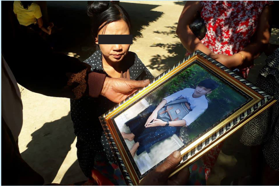
ရဲတပ်ဖွဲ့၏ ပတ်ခတ်မှုကြောင့် သေဆုံးသွားသူ အသက်(၁၈)နှစ်ရှိ တိုင်းရင်းသားတစ်ဦး

ရခိုင်ဘုရင့်နိုင်ငံတော်ကျဆုံးခြင်း အထိမ်းအမှတ် နှစ်ပတ်လည်အခမ်းအနားကျင်းပရန် တောင်းဆိုဆန္ဒပြ ပွဲတွင်ပါဝင်ခဲ့သည့် အသက် ၂၃ နှစ်အရွယ် ရခိုင်အမျိုးသားတဦးအား ရဲက ညှဉ်းပန်းနှိပ်စက်ရာ သေဆုံးသွား သည်။ လူပေါင်း ၄၀၀၀ ခန့် အစိုးရအဆောက်အဦးကို စီတန်းလှည့်လည်ပြီး နှစ်ပတ်လည် အထိမ်းအမှတ်အခမ်းအနား ကျင်းပခွင့်ပေးရန် တောင်းဆိုဆန္ဒပြကြရာ ရဲတပ်ဖွဲ့က လူအုပ်ထဲသို့ ရာဘာသေနတ်ကျည်ဖြင့် ပတ်ခတ်ခဲ့သည်။ သေဆုံးသွားသူမှာ ရဲစခန်းသို့ ဖမ်းဆီးခြင်းခံရပြီး သေဆုံးသည်အထိ ထိုးကြိတ်ခြင်းခံရသည်။ ရဲများက သူ့ရုပ် အလောင်းကို နောက်နေ့တွင် ဆေးရုံသို့ ပို့ဆောင်ခဲ့ သည်။ ရဲတပ်ဖွဲ့ကြောင့် လူ ၇ ဦးသေဆုံးပြီးနောက်ထပ် ၁၂ ဦး ဒဏ်ရာရခဲ့သည်။