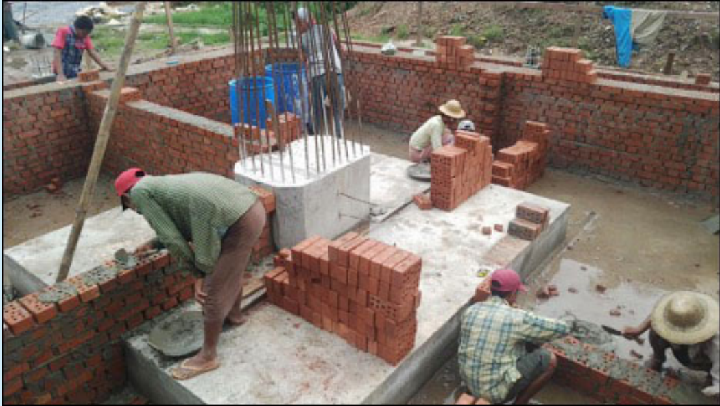
ဓာတ်ပုံ။ ရှစ်လေးလုံးအထိမ်းအမှတ်ကျောက်တိုင် စတင်တည်ဆောက်နေပုံ (ဓာတ်ပုံ၊ ဒီမိုကရေစီလှုပ်ရှားမှုကော် မတီ၊ ပဲခူး)

အစီရင်ခံသည့်ကာလအတွင်း လူ့အခွင့်အရေးချိုးဖောက်ခံရသူများအတွက် အစိုးရအနေဖြင့် အဓိပ္ပာယ်ပြည့်ဝသည့် ပြန်လည်ကုစားပေးလျော်မှု တစ်စုံတရာဆောင်ရွက်ပေးခြင်းမရှိပေ။ တိုင်းပြည်တွင်းရှိ အရပ်ဖက်အဖွဲ့အစည်းများကသာ (အစိုးရကိုယ်စား) နှစ်နာသူများအား ဆက်လက်ကူညီထောက်ပံ့နေသည်ကို တွေ့ရသည်။ ဖေဖော်ဝါရီလက ရန်ကုန်မြို့တွင် နိုင်ငံရေးအကျဉ်းသားဟောင်းများအတွက် အခမဲ့ကျန်းမာရေး စောင့်ရှောက်မှုပေးရန် တက်ကြွလှုပ်ရှားသူများနှင့် နိုင်ငံရေးအကျဉ်းသားဟောင်းများက ဖွင့်လှစ်ခဲ့သည်။ အစီရင်ခံစာရေးသားနေသည့်အချိန်တွင် ရှစ်လေးလုံးအထိမ်းအမှတ် ကျောက်တိုင် စိုက်ထူရန်အတွက် ပဲခူးတွင်ဆောင်ရွက်နေသည်။