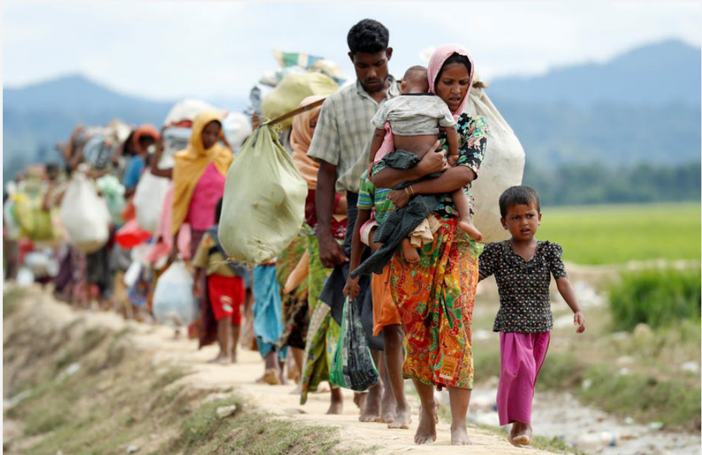
ရိုဟင်ဂျာဒုက္ခသည်များ မြန်မာနိုင်ငံမှ နေဘင်္ဂလားဒေ့ရှ်ဒုက္ခသည်စခန်းသို့ သွားလာနေပုံ။

လူ့အခွင့်အရေးချိုးဖောက်မှုများကို စုံစမ်းဖော်ထုတ်ရန် ကုလသမဂ္ဂမှ ဖွဲ့စည်းပေးထားသည့် အချက်အလက် ရှာဖွေရေးကော်မရှင်ကဲ့သို့ပင် ယန်ဟီလီးမှာလည်း တိုင်းပြည်သို့ ဝင်ရောက်ခွင့်ကို ပိတ်ပင်ခံထားရသည်။ လူ့အခွင့်အရေးချိုးဖောက်မှုများကို စုံစမ်းစစ်ဆေးရန်ပြည်တွင်းမှ အဖွဲ့ဝင် ၂ ဦးနှင့် ပြည်ပမှ အဖွဲ့ဝင် ၂ ဦး ပါဝင် ဖွဲ့စည်းထားသည့် နိုင်ငံတကာ ကော်မရှင်တရပ်ကို အစိုးရမှ ဖွဲ့စည်းခဲ့သည်။ အလားတူ ယခင်က ဖွဲ့စည်းခဲ့သည့် ကော်မရှင်များသည် စစ်သားများ ကျူးလွန်သည့် လုပ်ရပ်များအပေါ် အရေးမယူဘဲ ဖြေလျော့ပေးခဲ့ကြသည်။ ၃၁