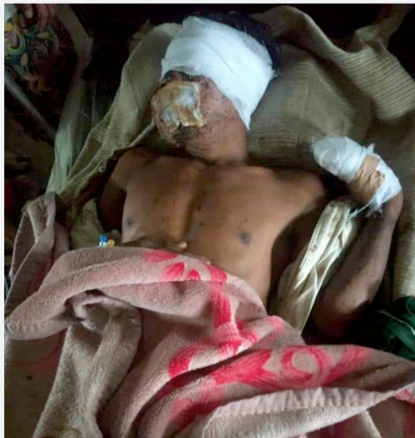
မြေမြှုပ်မိုင်းကြောင့် ဒဏ်ရာရရှိသူတစ်ဦး၊ ပလက်ဝ၊ ချင်းပြည်နယ်။

ကြူ.....ရွာမှ မိနစ် ၃၀ ခန့် လမ်းလျှောက်ရသည့် ကေ.....ရွာအနီးတွင် မိုင်းနင်းမိပြီး ၂၈ နှစ် အရွယ် အမျိုးသမီးတစ်ဦး သေဆုံးကာ ၁၈ နှစ်အရွယ် အမျိုးသမီးတစ်ဦး ဒဏ်ရာရသွားသည်။ ၂၀၁၈ ခုနှစ် အောက်တိုဘာ ၂၃ ရက် တွင်လည်း ပလက်ဝမြို့နယ်တွင် ၃၅ နှစ်အရွယ် အမျိုးသားတစ်ဦး မိုင်းနင်းမိပြီး ခြေထောက်တွင် ဒဏ်ရာပြင်းထန်စွာ ရရှိသွားသည်။ ရွာသားများ သည် မိုင်းနင်းမိမည်စိုး၍ တောတွင်းသို့ရှောင် ကွင်းသွားလာကြရသည်။ ရခိုင်တပ်မတော် အနေဖြင့် အဆိုပါဒေသတွင် လှုပ်ရှား သွားလာနေ သော်လည်း မည်သူထောင်သည့်မိုင်းဖြစ်သည်ကို မည်သူမျှ အတိအကျ မပြောနိုင်ကြချေ။