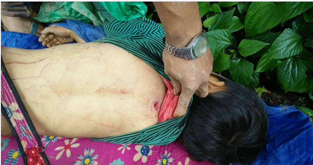
လက်နက်ကြီးဒဏ်ရာကြောင့် သေဆုံးသွားသော ကလေးငယ်ပုံ၊ ရှမ်းပြည်နယ်မြောက်ပိုင်း၊ ကွတ်ခိုင်၊

အစိုးရစစ်တပ် တပ်မ (၈၈) မှ ၂၀၁၈ ခုနှစ် ဇွန်လ ၂၈ ရက် နံနက်စောစောတွင် ရှမ်းပြည် မြောက်ပိုင်းမူဆယ်ခရိုင်ကွတ်ခိုင်မြို့နယ်-----ကျေးရွာတွင်တပ်စွဲထားသည့်တအာင်းအမျိုးသား လွတ်မြောက်ရေး တပ်မတော် TNLA ကို လက်နက်ကြီးဖြင့် ပစ်ခတ်ခဲ့ခြင်းဖြစ်သည်။ ရွာသားတဦးမှ “ဗမာတပ်ဘက်ကစပြီး ဘုန်းကြီးကျောင်း အထက်ကနေလက်နက်ကြီးတွေနဲ့ အရင်ပစ်တာ။ အိမ် တွေလည်းထိတယ်။ ပြီးတော့ ဗမာစစ်တပ်က ဆိုင်ကယ်၊ ကားတွေခေါ်ပြီး ဒဏ်ရာရတဲ့သူတွေကို ကွတ်ခိုင်မှာရှိတဲ့ တပ်ဆေးရုံကို ပို့လိုက်တယ်။ ဒဏ်ရာတွေ အရမ်းပြင်းထန်တယ်။ ရွာသားတွေလည်း အရမ်းကြောက်နေကြတယ်” ဟုပြောသည်။