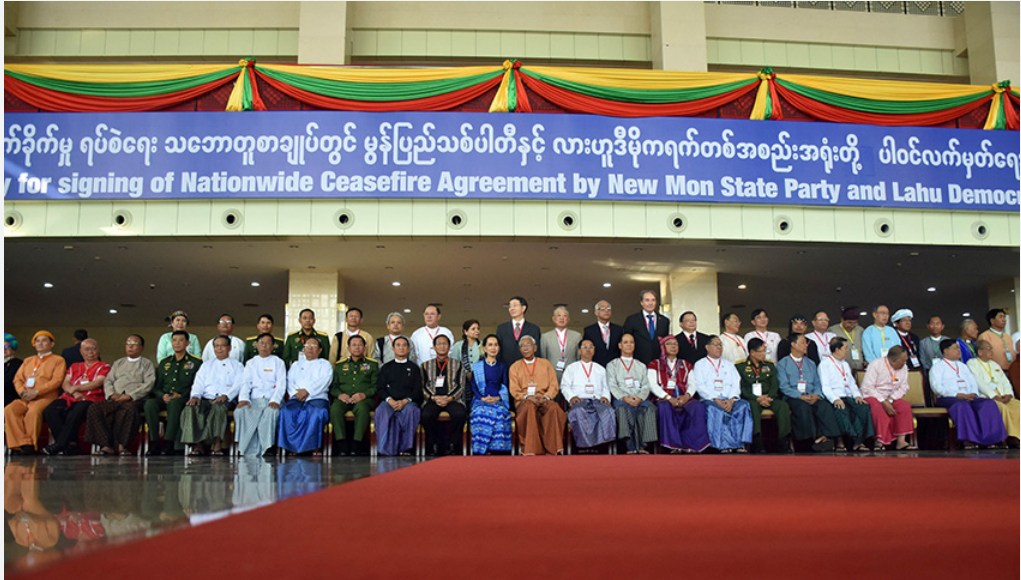
ပစ်ခတ်တိုက်ခိုက်မှု ရပ်စဲရေး သဘောတူစာချုပ် လက်မှတ်ရေးထိုးအခမ်းအနား နေပြည်တော်။

အောက်တိုဘာလတွင် အစိုးရနှင့် NCA လက်မှတ်ရေးထိုးထားသည့် EAOs များ ၂ ရက်ကြာ တွေ့ဆုံပြီး စေ့စပ်ဆွေးနွေးပွဲများတွင် သဘောတူညီမှုမရသေးသည့် အဓိကအချက် ၂ ချက်ဖြစ်သည့် ပြည်ထောင်စုမှ မခွဲထွက်ရေးနှင့် တစ်ခုတည်းသော တပ်မတော်ဖွဲ့စည်းရေးအတွက် ဆွေးနွေးရန် လမ်းညွှန်ချက်များ ချမှတ်ခဲ့သည်။ ၄ ကြိမ်မြောက် ၂၁ ရာစု ပင်လုံညီလာခံကို ၂၀၁၉ ခုနှစ် အစောပိုင်းတွင် ကျင်းပရန် သဘောတူကြသည်။