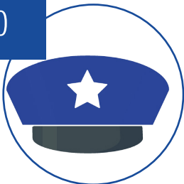
အစိုးရတပ်များ