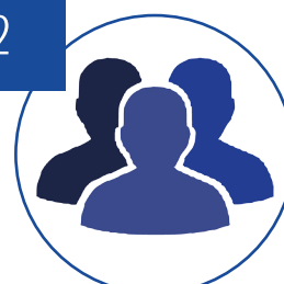
မြေမြှုပ်ခိုင်းနှင့်ပတ်သက်ပြီး မည်သည့်အဖွဲ့၏လက်ချက်မှန်း မသိရသည့်ဖြစ်ရပ်များ

ND-Burma ၏ မှတ်တမ်းများအရ ၂၀၁၉ ခုနှစ် ပထမ ၆ လအတွင်း လူ့အခွင့်အရေးချိုးဖောက်မှု များ သိသိသာသာ များပြားလာသည်ကို ပြသနေသည်။ တိုက်ပွဲဖြစ်ပွားရာဒေသရှိ ပြည်သူများမှာ စစ်၏ ဒဏ်ရာ၊ ဒဏ်ချက်များကို ခါးစည်းခံနေရပြီး၊ အစိုးရတပ်နှင့် တိုင်းရင်းသားလက်နက်ကိုင် အဖွဲ့များမှ ကျူးလွန်သည့် ဆိုးဝါးသော လူ့အခွင့်အရေးချိုးဖောက်မှုများကိုလည်း ခံနေရသည်။ ယခုအချိန်တွင် လက်နက်ကိုင် ပဋိပက္ခများ ရပ်တန့်ရန် အရေးတကြီး လိုအပ်နေပြီး လူ့အခွင့်အရေး ချိုးဖောက်မှုများ၏ နောက်ဆက်တွဲဆိုးကျိုးကို ခံစားရသူများအတွက် အစိုးရမှ ဦးဆောင် တာဝန်ယူ သည့် ပြန်လည်ကု စားပေးလျှော်မှု အစီအစဉ်များ ဆောင်ရွက်ရန်နှင့် အဆိုပါ ကျူးလွန်မှုများအတွက် အပြစ်ကျူးလွန်သူများ ပြစ်ဒဏ်ပေးအရေးယူခံရခြင်းမှ ကင်းလွတ်နေသည်ကိုလည်း အဆုံး သတ်ရမည်ဖြစ်သည်။